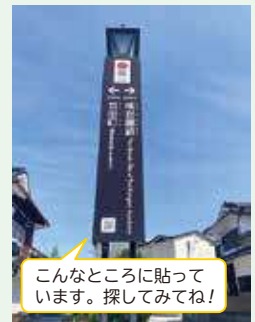
こんなところに貼っています。探してみてください!