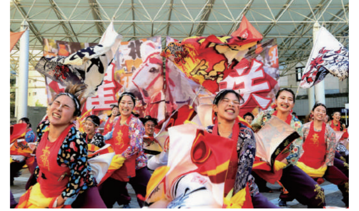
YOSAKOIさせば祭り

武蔵野美術大学油絵科卒業後、(株)ピックルスコオペレーションに入社。商品開発とデザインを担当。震災直後の「青森ねぶた祭」を訪れた際、地元の人々が心の底から楽しんでいる様子を見てお祭りの持つ力に気付く。同時に多くのお祭りが課題を抱えていることを知り、全国各地のお祭りを多面的にサポートする会社「株式会社オマツリジャパン」を創業。「青森ねぶた祭」や「岸和田だんじり祭」をはじめ、大小問わず数多くの地域の祭りへの支援実績を持つ。2児の母。