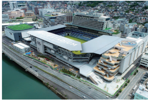
長崎スタジアムシティ(2024年10月開業)

分科会においては、長崎地域や全国で展開されるスポーツイベントなどを参考に、スポーツによる観光まちづくりについて考えます。