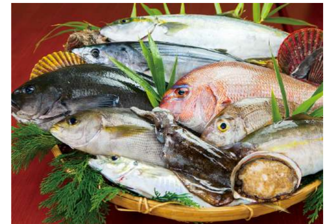
長崎県の新鮮な魚

分科会においては、観光との連携強化による地場産業の活性化や身近な地域資源の活用への取り組みなどを紹介し、「食」を活用した観光まちづくりについて考えます。