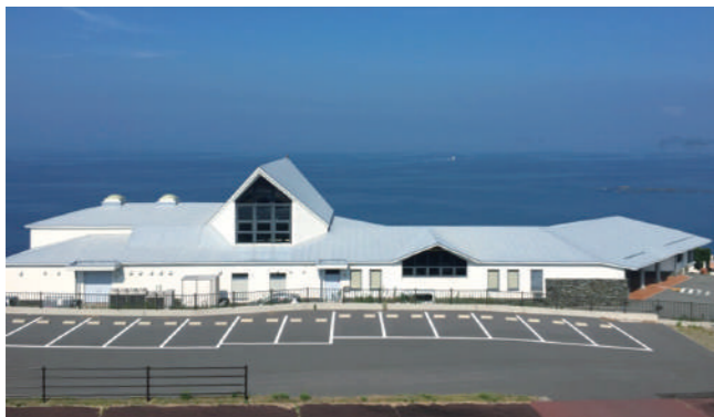
長崎市遠藤周作文学館 (イメージ)