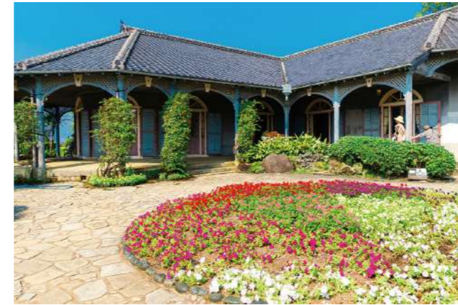
グラバー園(イメージ)