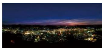
稲佐山からの夜景 (イメージ)