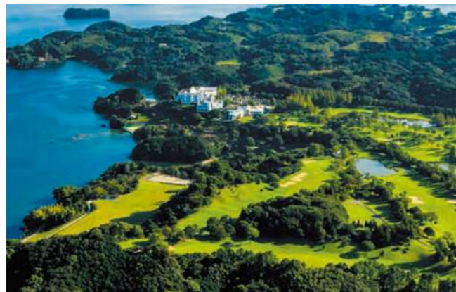
パサージュ琴海アイランドゴルフクラブ (イメージ)