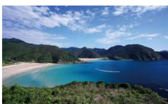
高浜海水浴場(イメージ)

長崎県は離島の数がNO.1として知られています。ジェットfoilを利用して五島列島の福江島を訪れ、美しい海岸の景色や、海の幸、山の幸を五感でお楽しみいただけます。