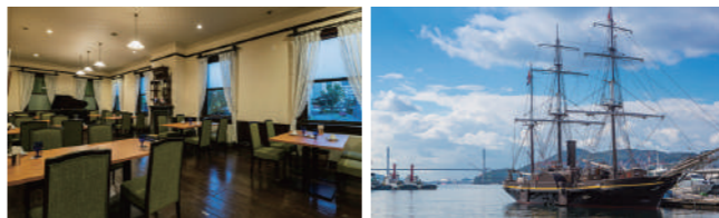
長崎内外倶楽部 (イメージ)