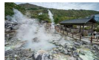
雲仙地獄 (イメージ)