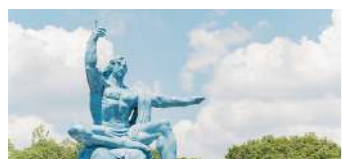
平和公園 (イメージ)