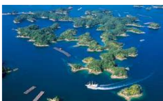
九十九島(イメージ)

日本最大のテーマパーク「ハウステンボス」では光り輝くイルミネーションがみどころ。園内散策やアトラクションも体感いただけます。絶景九十九島、佐世保の歴史、佐世保バーガーと盛り沢山!