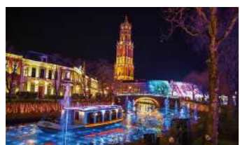
ハウステンボス(イメージ)