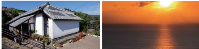
ド・ロ神父記念館 (イメージ)