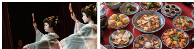
長崎検番 (イメージ)