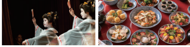
長崎検番 (イメージ)