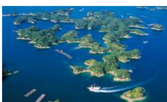
九十九島(イメージ)

日本最大のテーマパーク「ハウステンボス」では光り輝くイルミネーションがみどころ。園内散策やアトラクションも体感いただけます。絶景九十九島、佐世保の歴史、佐世保バーガーと盛り沢山!