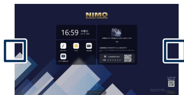
ホーム画面両端のマークからサイドバーを表示